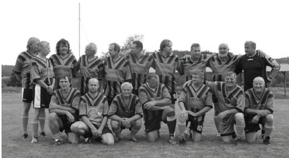
Stará garda TJ Tatran

Úspěšný byl oddíl ledního hokeje, který zde byl velmi populární, hlavně v dobách kdy mrzlo. Hrál se zde aktivně od roku 1941 a úplně skončil v roce 1984. Nejúspěšněji v 50. a 60. letech, kdy mužstvo dospělých patřilo do