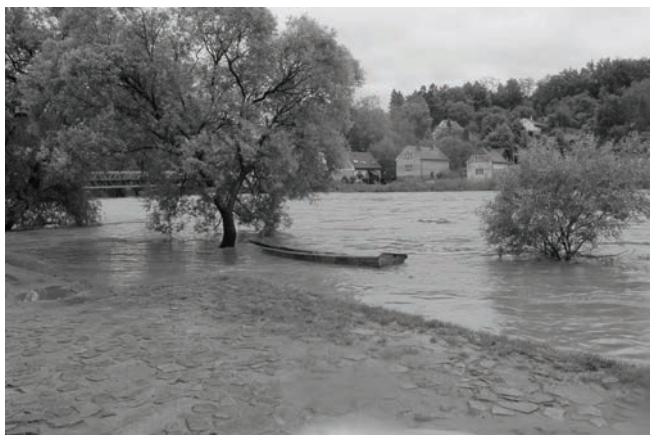
Sázava červen 2013

predstavujeme vám několik dalších fotografií tentokrát řeky Sázavy v Kamenném Přívoze v kontrastech přívalových dešťů a sucha. Od povodní v roce 2013 se Sázava pod Krhanicemi až na krátké výjimky stala spíše velkým kamenitým potokem než řekou, na kterou jsme byli zvyklí. I to jsou proměny, na které si