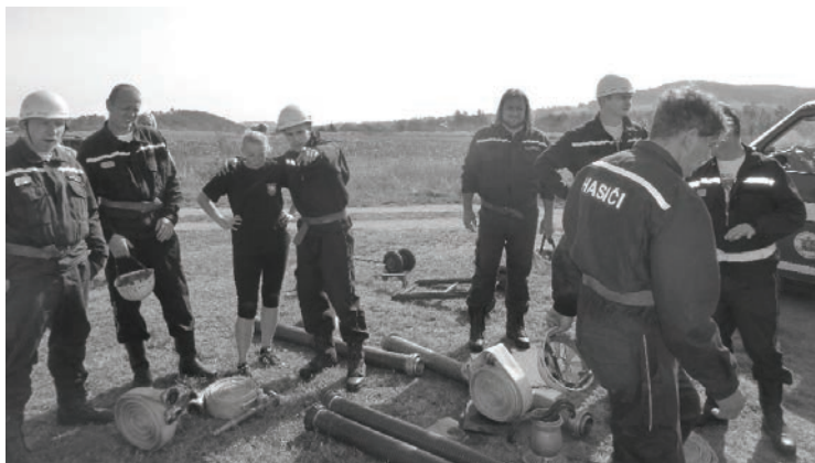
Hasiči SDH Kamenný Újezdec

ženy ze Zlatníků a druhé místo si udržely naše ženy z Kamenného Újezdce. Po ženách přišly na řadu muži. V prvním kole byly časy dost vyrovnané, tak se čekalo na časy z druhých útoků. Naši muži z Kamenného Újezdce si připravili do druhého kola dobrou výchozí pozici. Když na ně přišla řada, druhý útok začali velice dobře, ale když po rozhození všech hadic začala téct voda, tak najednou mašina řekla dost a zastavila se. Náhle byl konec všem nadějším na dobré umístění. Tady je vidět, že i když jste perfektně připraveni a to naši chlapi byli, vypoví službu technika a je po všem. Tak je tomu i v požárním sportu. Újezdčáci, tak až příště. Vždyť v loňském roce naše ženy tuto soutěž vyhrály a muži byli na místě druhém. Při závěrečné