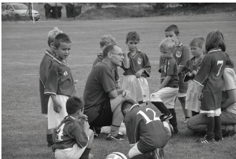
Přípravka TJ Tatran