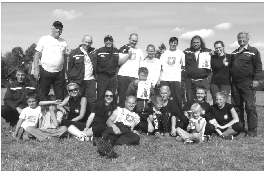
Hasiči SDH Kamenný Újezdec

skupině „B“ na 1. místě „Triumfátor“ Vávrovka“ K. P. a na 2. místě „Rebelové“ Praha. Zbylá družstva hrála o 5 až 7. místo. Po urputných bojích do finále postoupila družstva: „Triumfátor“ Vávrovka K. P. – „Rebelové“ Praha. Vítězně z tohoto finálového duelu vyšli hráči „Triumfátor“ Vávrovka K. P., když soupeře porazili 4 : 0 a stali se vítězi celého turnaje (již po několikáté). „Rebelové“ Praha obsadili 2. místo.