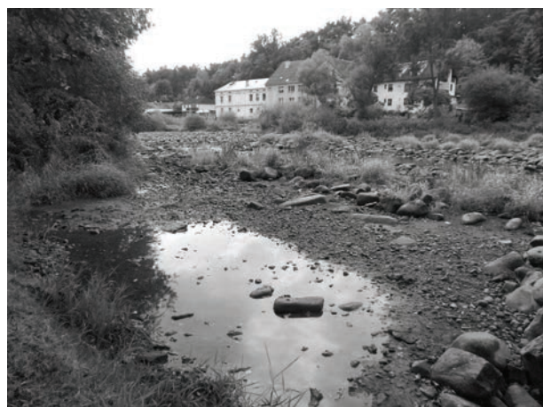
Sázava 29.8.2016 v 11 hodin

V poslední době se asi čas zrychlil, takže i vícekrát za den v Sázavě voda teče a za chvíli téměř neteče, průtok se mění během dne v násobcích. Jistě to má neblahý vliv na faunu i floru řeky.