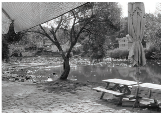
Sázava září 2016