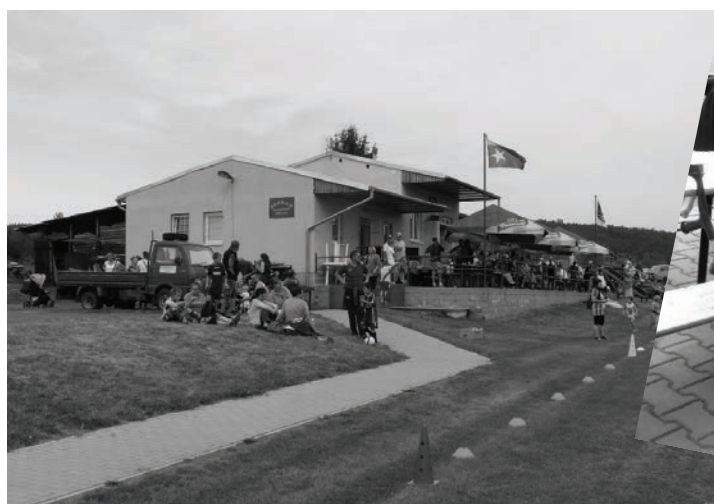
Kabiny TJ Tatran