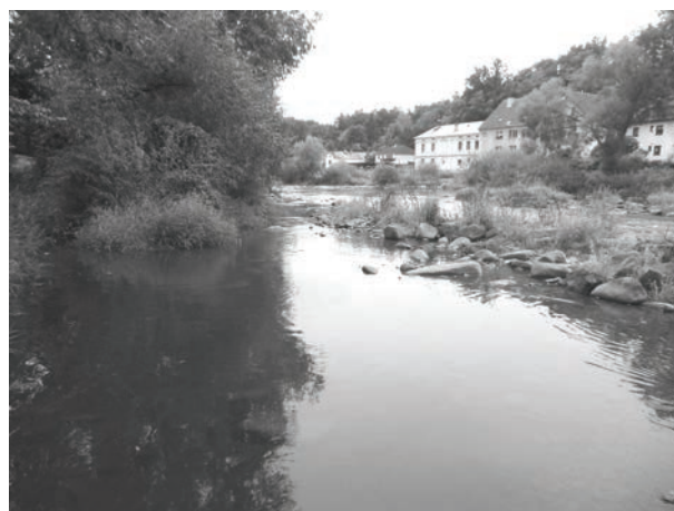
Sázava 29.8.2016 v 13 hodin

S přáním příjemných chvil při čtení Přívozského čtvrtletníku se na vaše příspěvky těší redakce ctvrtletnik@kamennyprivoz.cz