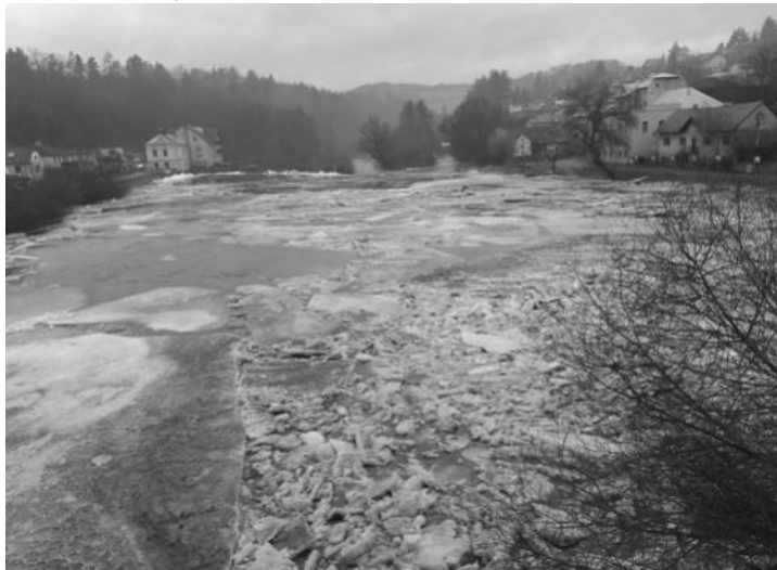
Sázava v Kamenném Přívoze pod mostem 22.2. 2017