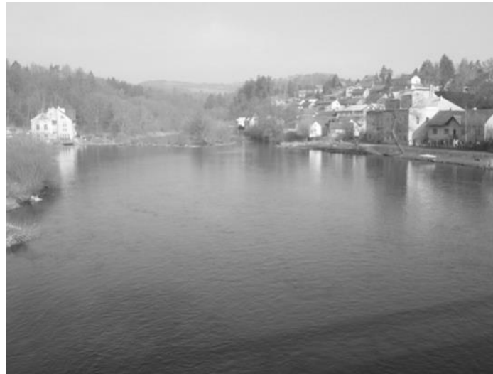
Sázava v Kamenném Přívoze pod mostem 7.3.2017